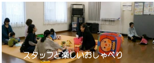
スタッフと楽しいおしゃべり

乳幼児とママ達の、気軽に集まれる広場です♪ お友達作りや情報交換などの場になっています。 ♥ は、ママ達の声です。