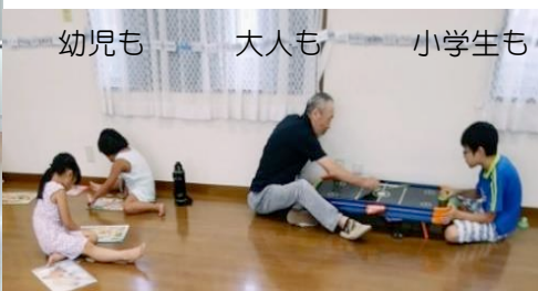
幼児も 大人も 小学生も