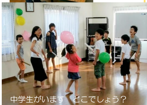
中学生がいます どこでしょう?

*オセロやブロック、もの作りの材料や文具を常備して、楽しい時間を過せるよう、スタッフは見守りをしています。