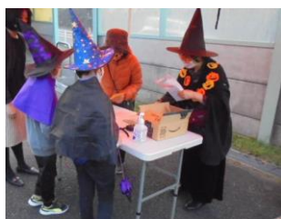
ゴールは谷津坂南公園 プレゼントは何か？