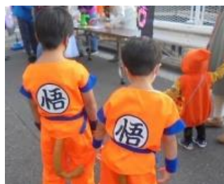
カッコ良い二人！兄弟？