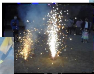
今年は花火も出来ました♪ 楽しかったね！