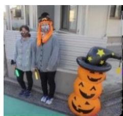
見守りサポーターのママたち