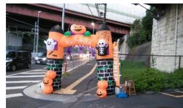
ハロウィンゲートがお出迎え