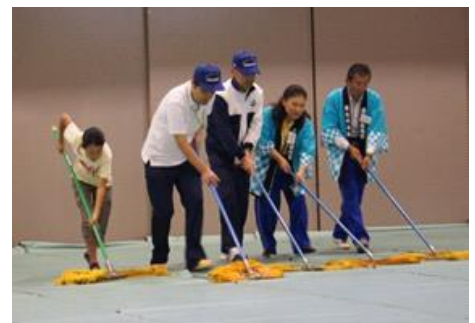
終了後の片付け・清掃