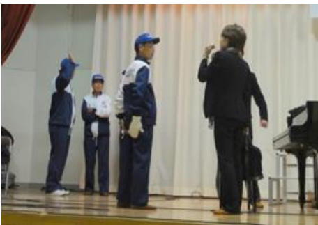
出演者と打ち合わせ